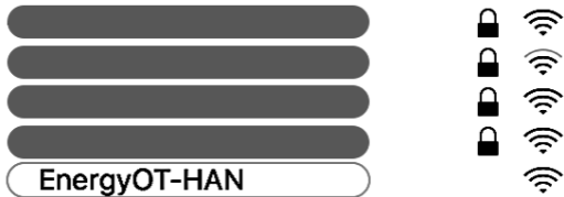
Figura 5 Seleccione a rede Wi-Fi "EnergyOT-HAN"