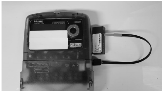
Figura 4 Ligação do dispositivo ao Contador (EDP box)